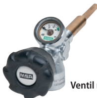
Ventil mit Manometer